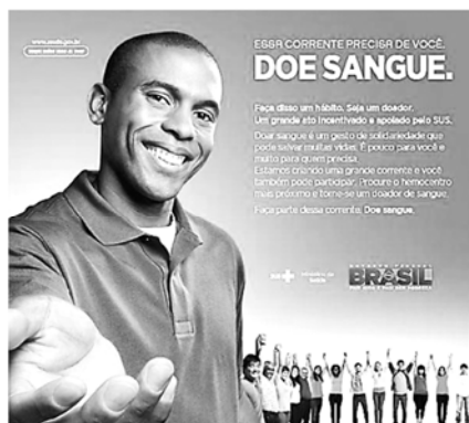
(Figura ampliada na página 14)

Disponível em: < https://www.into.saude.gov.br >. Acesso em: 27 dez. 2016, com adaptações.