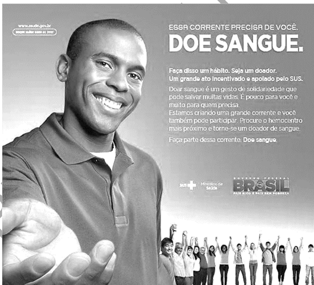
Figura ampliada do Texto 1 da prova discursiva.