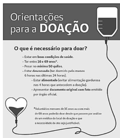
(Figura ampliada na página 14)

BRASIL. Ministério da Saúde. Fundação Pró-Sangue. Banco de Sangue Grupo Gestão e Tecnologia em Saúde. Disponível em: < http://www.unimed.coop.br/pct/index.jsp?cd_canal=53023&cd_secao=53015&cd_materia=370105 >. Acesso em: 24 dez. 2016.